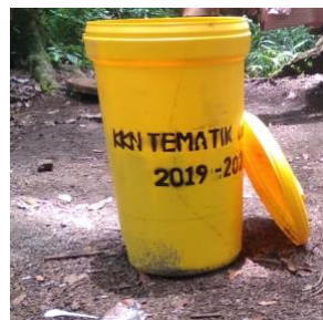
Gambar 7. Bak sampah di kawasan hutan

Permasalahan utama di kawasan wisata Alam Aik Nyet adalah banyaknya sampa yang berserakan sehingga tidak enak dipandang. Permasalahan sampah tersebut disebabkan oleh banyak faktor, salah satunya adalah kurangnya kesadaran dari masyarakat dan wisatawan tentang kebersihan sehingga banyak dari mereka yang membuang sampah tidak pada tempatnya. Selain itu, faktor lainnya adalah kurangnya fasilitas tempat pembuangan sampah sangat sedikit sehingga hal tersebut membuat pengunjung kebingungan untuk membuang sampahnya. Oleh karena itu, agar kebersihan dan keindahan wisata Alam Aik Nyet tetap terjaga, maka salah program kerja utama yang dibuat oleh kelompok KKN Universitas Mataram adalah pengadaan bak sampah.