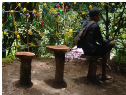
Gambar 3. Tempat duduk dari kayu

Selain pegangan tangga, fasilitas yang ditambahkan yakni tempat duduk dari kayu. Tempat duduk dari kayu dibuat di dalam kawasan hutan wisata yang bertujuan agar lebih terlihat alami dan terkesan menyatu dengan alam.