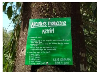
Gambar 9. Penamaan Pohon

Pembuatan papan nama dan deskripsi pohon merupakan program kerja utama yang bertujuan untuk memberikan informasi kepada pengunjung berbagai jenis pohon yang ada di kawasan hutan. Selain itu, papan informasi ini juga memuat deskripsi singkat tentang pohon yang bersangkutan. Dengan demikian, pengunjung tidak hanya dapat menikmati keindahan wisata Alam Aik Nyet, tetapi para pengunjung juga mendapatkan pengetahuan mengenai nama-nama latin pohon yang ada disekitar taman. Hal ini dapat menjadi nilai tambah wisata alam Aik Nyet, yakni dapat menjadi wisata edukasi. Papan nama pohon terbuat dari seng dan dicat dengan warna hijau dan tulisannya berwarna putih. Tidak hanya nama latin dan nama lokal saja, papan nama pohon tersebut memuat deskripsi tentang asal dan manfaat dari pohon tersebut.