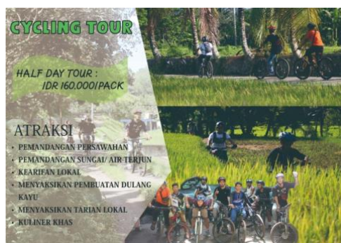
Gambar 12. Paket wisata

Pembuatan paket wisata merupakan salah satu program kerja tambahan. Adapun tujuan pembuatan paket wisata adalah untuk menarik perhatian wisatawan dan juga memberikan kemudahan kepada wisatawan untuk berwisata di wisata Alam Aik Nyet.