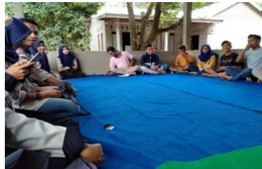
Gambar 13. Pelatihan Kepariwisata

Program kerja tambahan lainnya adalah pelatihan kepariwisataan yang sasarannya adalah pengelola wisata Alam Aik Nyet. Tujuan utama pelaksanaan kegiatan pelatihan kepariwisataan tersebut adalah agar para pengelola mendapatkan pengetahuan bagaimana mengelola wisata dan mereka mengerti tanggung jawab masing-masing.