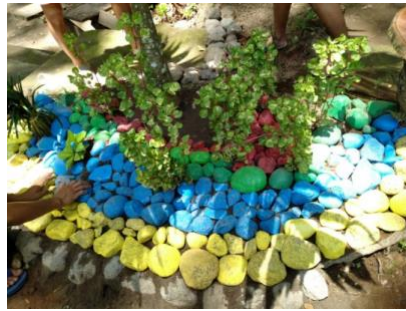
Gambar 8. Pembuatan taman bunga