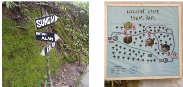
Gambar 6. Petunjuk jalan dan peta wisata Aik Nyet