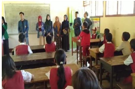
Gambar 11. Mengajar di SDN 2 Buwun Sejati

Mengajar di SDN 2 Buwun Sejati merupakan program kerja tambahan. Kegiatan mengajar dilakukan selama seminggu di minggu terakhir KKN. Kelas yang diajar hanya tiga kelas yakni kelas 4, 5 dan 6.