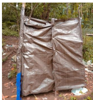
Gambar 5. Pembuatan ruang ganti

Pembuatan ruang ganti merupakan fasilitas yang dibuat untuk memberikan kenyamanan dan kemudahan kepada pengunjung berganti pakaian setelah selesai bermain air di sungai yang ada di Wisata Alam Aik Nyet. Kamar ganti terbuat dari terpal sebagai dindingnya dan kayu sebagai kerangkanya. Lokasi pembuatan ruang ganti berada di pinggir sungai.