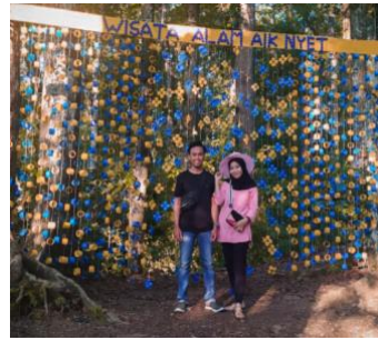
Gambar 10. Salah satu spot foto yang dibuat