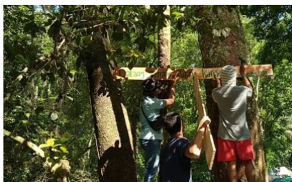
Gambar 1. Perbaikan papan tulisan yang sudah rusak

Kegiatan Pembenahan merupakan kegiatan membenahi dan memperbaiki fasilitas yang sudah ada namun sudah tidak layak, seperti perbaikan papan-papan tulisan yang sudah rusak. Karena, beberapa papan tulisan yang ada di kawasan hutan wisata sudah pudar bahkan rapuh sehingga perlu diganti dengan yang lebih baik.