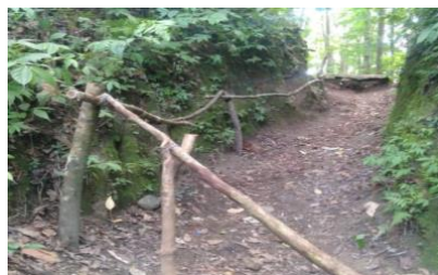
Gambar 2. Pembuatan pegangan tangga menuju sungai

Adapun penambahan fasilitas merupakan kegiatan pengadaan fasilitas yang belum ada di kawasan wisata. Kegiatan penambahan fasilitas salah satunya adalah pembuatan pegangan tangga menuju sungai. Hal ini dilakukan karena jalan menuju ke sungai sangat curam dan licin, sehingga banyak orang yang terpeleket ketika melewatinya. Pegangan tangga terbuat dari ranting pohon dan diikat menggunakan kawat dengan kuat, sehingga dapat memudahkan pengunjung ketika melewati jalan tersebut.