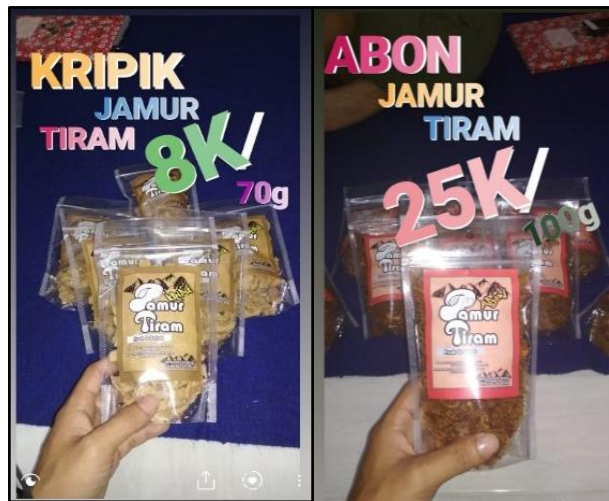
Gambar 5. Model flyer iklan produk kripik dan abon jamur tiram