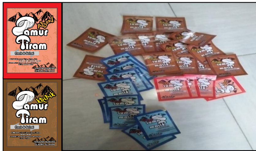
Gambar 3. Hasil desain label bungkus produk jamur tiram

Sesi praktik teknik pemasaran dengan memanfaatkan IT melalui media online, kegiatan ini diikuti oleh peserta yang terdiri atas para pemuda dan pemudi yang telah dipilih dan memiliki latar belakang ilmu komputer ( Gambar 4 ). Peserta dibekali pengetahuan mulai dari proses pembuatan email, fitur-fitur tambahan dalam media iklan sampai pada teknik memasarkan produk secara online ( Gambar 5 dan Gambar 6 ). Meskipun kegiatan PPM hanya berlangsung selama satu hari namun kegiatan pendampingan, monitoring dan evaluasi terus dilakukan.