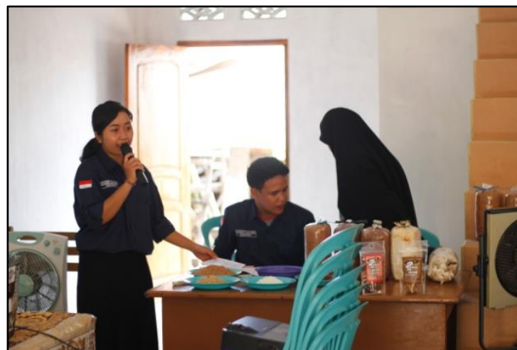
Gambar 2. Pengarahan dari mahasiswa terkait pelabelan produk jamur tiram

Sesi praktik dibimbing langsung oleh para mahasiswa ( Gambar 2 ), pada tahap ini peserta dilatih untuk mendesain model label produk olahan jamur tiram ( Gambar 3 ), selain mendapat bimbingan langsung ( Gambar 4 ), peserta juga bebas bertanya terkait kesulitan yang ditemui selama proses pelatihan berlangsung.