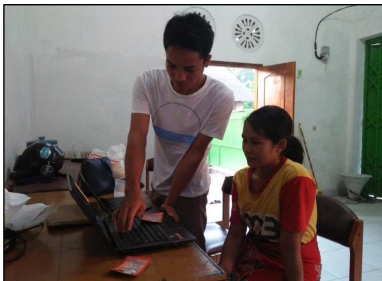
Gambar 4. Pelatihan pembuatan desain fitur pemasaran produk keripik

Sesi praktik teknik pemasaran dengan memanfaatkan IT melalui media online, kegiatan ini diikuti oleh peserta yang terdiri atas para pemuda dan pemudi yang telah dipilih dan memiliki latar belakang ilmu komputer ( Gambar 4 ). Peserta dibekali pengetahuan mulai dari proses pembuatan email, fitur-fitur tambahan dalam media iklan sampai pada teknik memasarkan produk secara online ( Gambar 5 dan Gambar 6 ). Meskipun kegiatan PPM hanya berlangsung selama satu hari namun kegiatan pendampingan, monitoring dan evaluasi terus dilakukan.