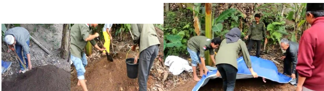
Gambar 2. Proses pembuatan pupuk

Kedua pupuk tersebut memiliki kelebihan dan kekurangan. Kelebihan yang dimiliki oleh pupuk anorganik (pupuk buatan pabrik) antara lain: 1) praktis dalam penggunaan, 2) tidak membutuhkan banyak waktu dan tenaga, dan 3) mudah diserap tanaman. Adapun kekurangan yang dimiliki oleh pupuk anorganik adalah: 1) merusak tekstur dan struktur tanah dan 2) produk yang dihasilkan berbahaya bagi tubuh.