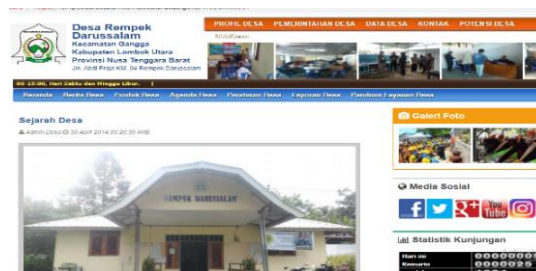
Gambar 1. Tampilan Website Desa Rempek Darussalam

Hasil kegiatan KKN ini yaitu informasi mengenai desa rempek Darussalam yang terdapat di SID dan website menjadi rampung dan informasi mengenai desa tersebut dapat diakses publik sehingga desa Rempek Darussalam lebih dikenal. Adapun alamat website desa rempek Darussalam dapat diakses melalui https://rempekdarussalam.lombokutarakab.go.id/ . berikut ini adalah tampilan website dari desa rempek Darussalam.