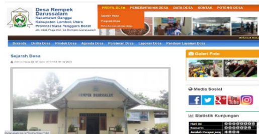
Gambar 2. Tampilan Salah Satu Menu Website

Pada tampilan website desa tersebut dapat dilihat beberapa menu dan sub menu yang dapat di klik sesuai dengan informasi yang ingin kita peroleh. Misalnya jika memilih menu profil desa maka akan tampil gambar sebagai berikut.