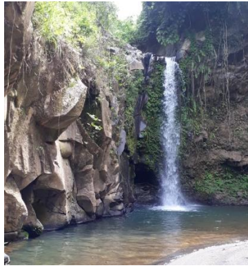
Gambar 5. Potensi Wisata Air Terjun Kahuripan