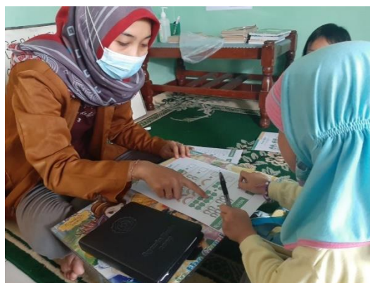
Gambar 4. Tahap pendampingan RCU Bunayya

Selama proses bimbingan belajar di RCU Bunayya, mahasiswa KKN intens melakukan pendampingan pada kegiatan pembelajaran dalam bentuk pemberian soal/penugasan untuk pengayaan materi pelajaran oleh siswa. Pendampingan dilakukan untuk mengetahui pengetahuan dan pemahaman siswa selama beberapa kali pertemuan bimbingan belajar. Hal ini diharapkan siswa lebih mengasah kemampuan. Karena selama pandemic Covid-19, siswa lebih banyak belajar di rumah dengan pendampingan orangtuanya masing-masing. Kalau orangtua bekerja maka anak belajar diwaktu malam hari setelah orangtua pulang kerja. Pelaksanaan pendampingan belajar siswa/anak di RCU Bunayya di Desa Jetis, Sukoharjo adalah sebagai berikut.