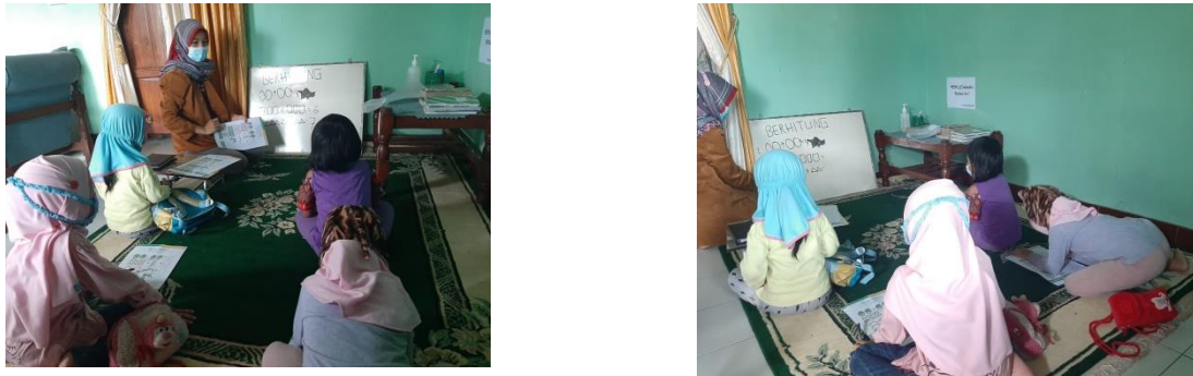
Gambar 3. Mahasiswa KKN memberi materi pada anak

Selama proses pelaksanaan bimbingan belajar, mahasiswa KKN juga memberikan materi seperti mengajar sesungguhnya yang dilakukan oleh guru ketika di kelas. Mahasiswa KKN menjelaskan materi pelajaran dibantu dengan white board kecil dan spidol. Sarana pendukung bimbingan belajar tersebut agar lebih memahamkan siswa/anak. Karena ada siswa yang masih tergolong usia Taman Kanak-Kanak. Berikut ini kegiatan mengajar mahasiswa KKN pada anak di Desa Jetis, Sukoharjo.